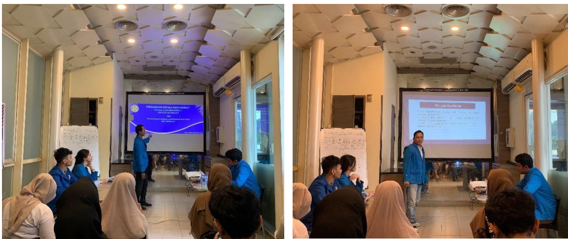
Gambar 2. Sambutan Ketua PKM(a) Sesi Sosialisasi(b)