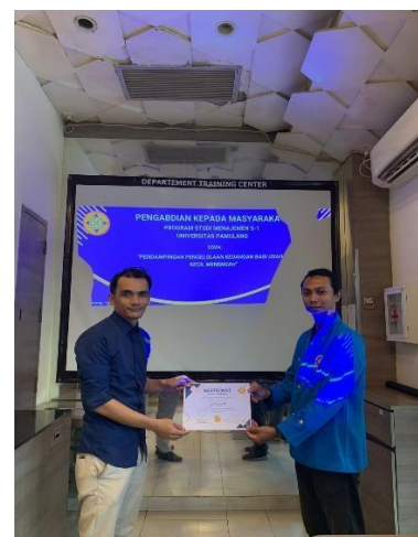
Gambar 1: Gambar 2. Seputar momen kegiatan saat melakukan kegiatan pendampingan pada Masyarakat mengenai materi pengolahan keuangan usaha UMKM (a) penyampain materi kepada peserta (b) sesi tanya jawab untuk peserta menayakan pertanyaan terkait materi (c) penyerahan sertifikat kepada ketua perwakilan peserta.